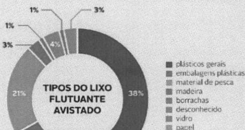
Figura 1 - Tipo de lixo flutuante (em %) avistado durante a monitorização POPA do lixo marinho em 2016

Nesse âmbito, iniciámos em 2015 o primeiro programa de monitorização de lixo marinho flutuante com ajuda dos observadores do POPA. Os primeiros resultados mostram que o tipo de lixo flutuante mais encontrado é o plástico (figura 1) e que este se espalha um pouco por todo o Arquipélago (mapa 1).